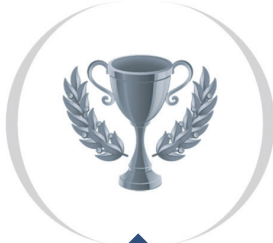
Seria podstawowa - SilverLine