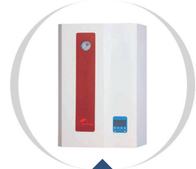
Dywizja - niezniszczalna kaskada