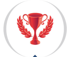
Seria przemysłowa - RedLine