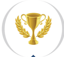
Seria zaawansowana - GoldLine