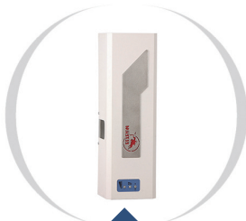
Ulan - cena od 1700 zł netto