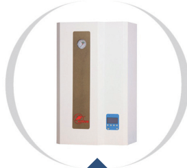
Pułkownik - lider eksportu 2016